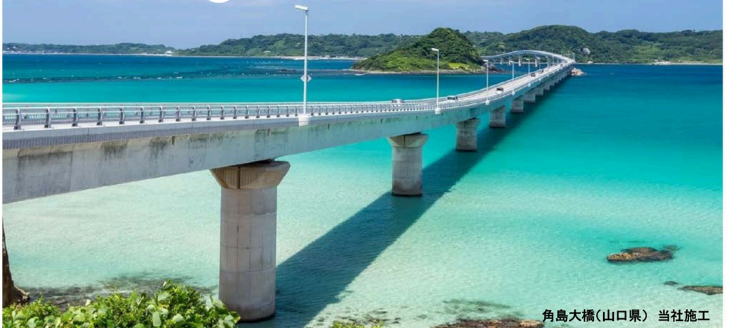
角島大橋(山口県) 当社施工